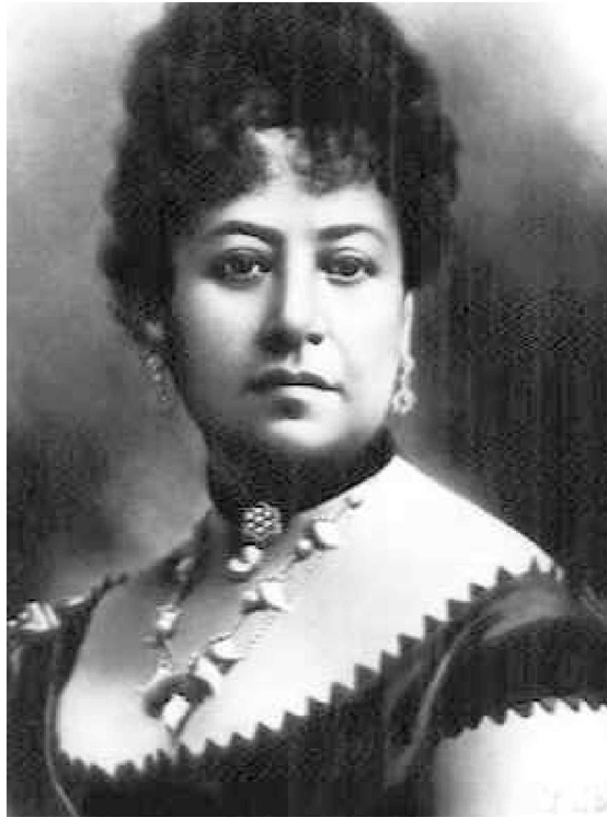
Ke Kuini 'Emalani, ka mea nāna i ho'okumu i ka Haukapila 'o Queen's.

I hea ka ha'ina e hemo ai kēia pilikia nui? 'O kākou nō ka ha'ina. 'Auhea 'oukou e nā kauka a me nā kahu ma'i Hawai'i! Na kākou ke kuleana. Ikaika ka lāhui i ka ikaika o nā kānaka, no laila, e lōkahi kākou a pau a e kōkua i ka ho'onui 'ana i ka ho'ōla kino. Aia a laulima kākou no ka hō'ikaika 'ana i ka lāhui, a laila e polapola nō kākou! E ola nō!