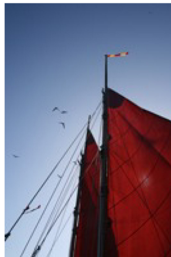
He 'āuna iwa.

Pō ia ao lā, a i ke ao 'ana o ka pō, 'ike hou akula i kahi manuokū hou, a i manuokū hou, a i manuokū hou. 'Ekolu manu me kēia ke 'ano a mākou i 'ike aku ai i nēia lā. 'O kekahi, hele ho'okahi nō ia. 'O kekahi, hui ia me ka pū'ulu 'ewa'ewa me ka noio kōhā. A pō ia ao, a ao ho'i ka pō, ua 'oi a'e ka nui o nā manu like 'ole o kai i 'ike 'ia. A 'o ka manuokū, pū'ā 'ia nō. 'Ike 'ia ho'i he 'ōpala e lana ana ma ka 'ilikai, 'o ka 'ōmole wai a he mau ea 'oko'a, kahi 'āpana 'upena, a 'o ke kupaianaha, 'ike 'ia ho'i hā ka lau niu. Ma muli o kēia mau mea nei i maopopo ai iā mākou, e pili aku ana nō ka wa'a i ka moku. 'O ke ka'aka'a a'ela nō ia o ka maka 'ike.