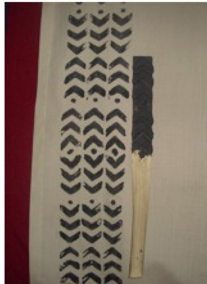
he kapa i kāpala 'ia

He aha ke kumu o ia ka'ina hana? He lolina ia. E no'ono'o i ia mea he oli. Nui nā 'ano o ke oli a nui nō ho'i ke kumu no ke oli 'ana. 'O ia ho'i, he mea ia e hō'ike ai i kou mo'omeheu, kou mahalo, kou kaumaha, he 'ano malu, a he hea i ke akua kekahi. Loa'a he mau kumu hou a'e, akā, 'o nā akua ka