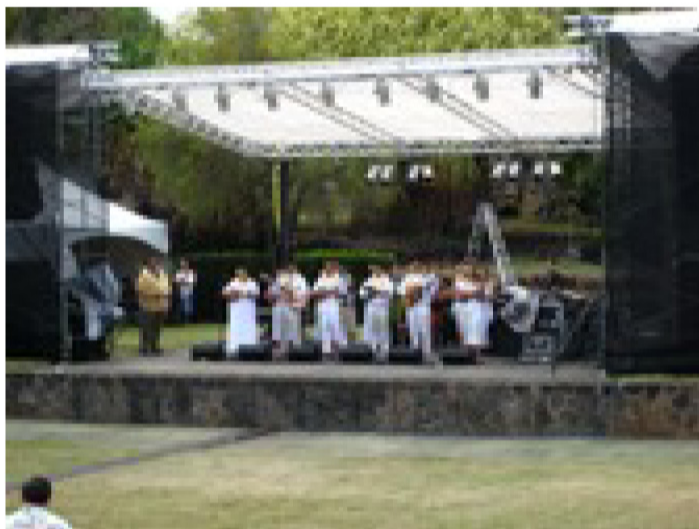
‘O ka pulapula kēia e ho`omau nei ma ke ala no`eau.

Lana ka mana`o o kēia wahi mea kākau, na kēia mo`olelo i kanu i kahi hua i loko ou, e ka mea heluhelu, a e ulu ana kēlā hoihoi a me ka `i`ini e hele a kama`āina me nā leo Hawai`i makamae o kēia `āina hiwahiwa. I laila nō ka waiwai o ke a`o `ana mai, ma nā mele a ma nā mo`olelo i ha`i `ia, i hīmeni `ia a i ho`okani `ia e lākou. He mea minamina `ia ka wai a ka manu `alamea.