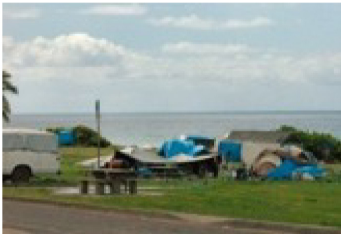
Me kēia paha ka noho 'ana o ia po'e kuwena nei.

Hele nā keiki i ke kula no ka mea 'a'ole koi 'ia he wahi noho no ka hele kula 'ana. No laila, hiki iā lākou ke hele i ke kula a loa'a mai iā lākou ka mea 'ai.