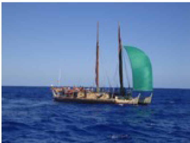
Ma muli o ka pā iki 'ana mai o ka makani, kau kēia 'ano pe'a hou loa o ka wa'a, kapa 'ia he pe'a sapinaka.

papahēle. 'O i aku ka nui o kēia kula nui o Hawai'i nei ma mua o ia 'āina holo'oko'a. E 'ole ka piha akamai o ka ho'okele, hala a'e nā 'ale o ka moana, hao mai ka moana kau i ka weli, he mea 'ole na'e ia i nēia ho'okele.