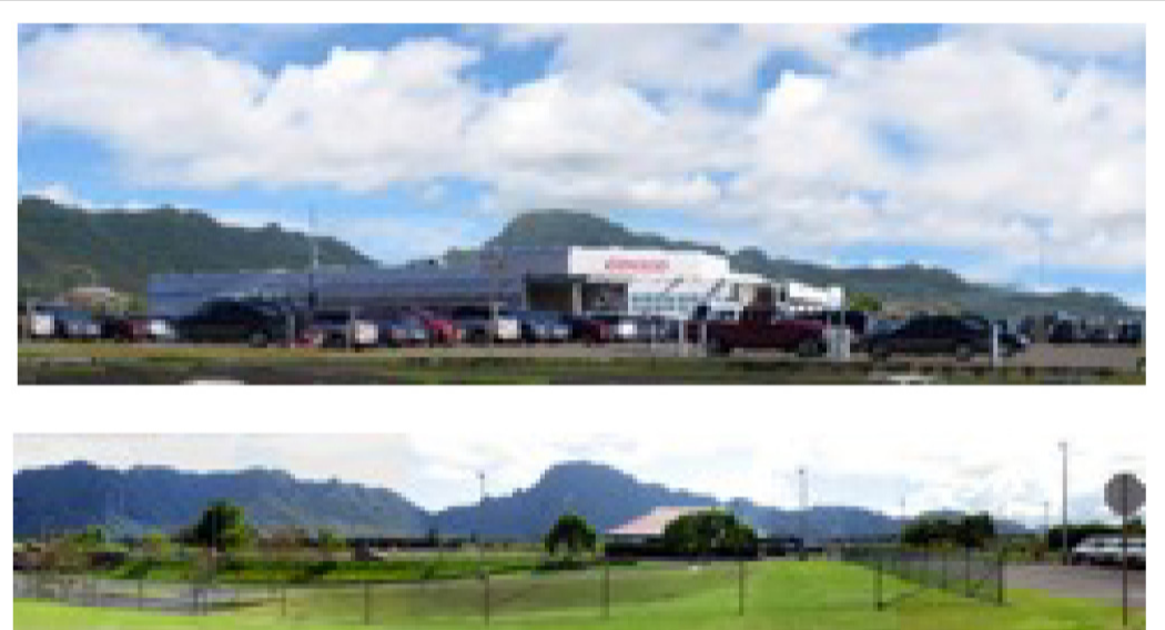
'O kahi like nō kēia i Kaua'i o Mano. 'Ike 'ia nō ka loli 'ana o ka 'āina ma muli o ka 'ō'ili 'ana mai o ia hale nunui.

Eia kekahi pilikia i kupu mai ma muli o ka ho'okumu 'ia 'ana o Costco mā, 'o ia ho'i ka pau 'ana o nā pahu Matson iā lākou. Ua kū'ai mai 'o Costco a me Walmart i nā pahu nui ma nā moku o Matson. I Kaua'i, pae ko Matson mau moku i Nāwiliwili i 'elua