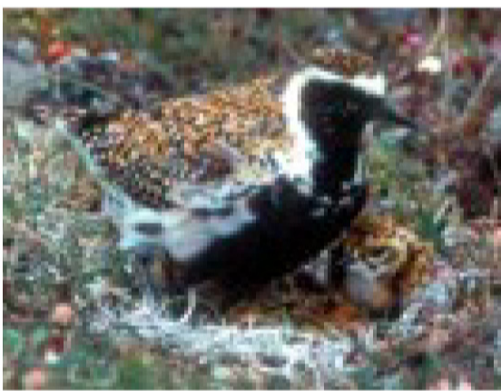
he manu kōlea me kāna punua, aia i Kahiki

I ka lā 20 o Pepeleluali, ua na'i 'ia mai he hale e kū ana i nēia 'āina a lilo akula i ke ali'i nui kua 'ōma'oma'o o kēia wā, 'o ia ho'i ke kālā. Uku 'ia he