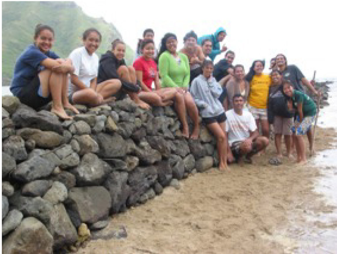
Eia ka papa mālama loko i'a a ka mea kākau. Aia i kai o Kahana.

E nā pua, mai hopohopo i ka heluhelu 'ana e pili ana i ka hana 'ino o ke aupuni. I kēia manawa, e ulu ana ka hoi a me ka ho'omaopopo 'ana i ka waihona 'ike o nā mea 'elua, 'o ia ho'i ka papa lo'i a me ka loko i'a. I kēia kau, ke a'o 'ia nei ka papa Mālama Loko I'a i ka hālau 'ike Hawai'i ma ke kula nui o (ho'omau 'ia i ka 'ao'ao 7)