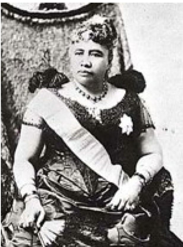
Ma hope mākou o Lili'ulani.

E ka nalu nui o ka 'ino, ka mea nāna e po'i ma luna o ka po'e he'e nalu; a me ka makani pāhili e pāhola mai nei ma luna o kēia 'āina ho'opulapula o kākou, e maliu mai.