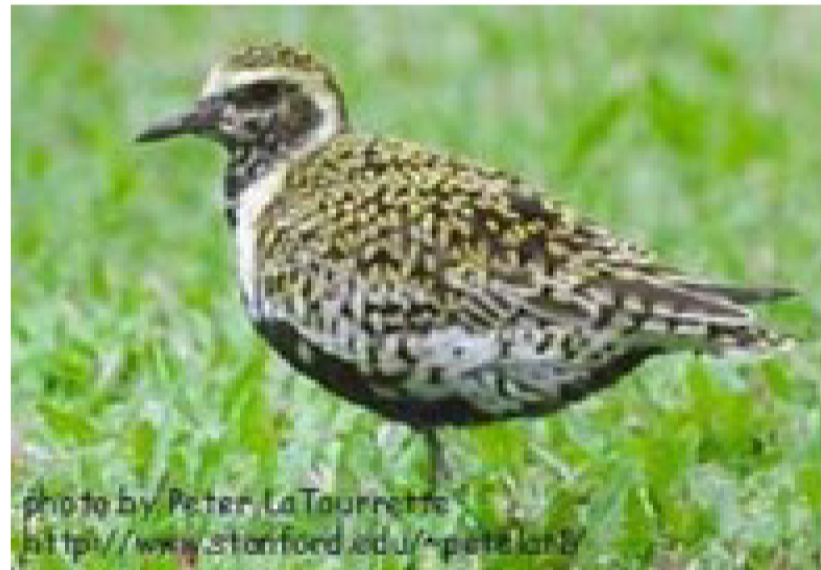
He kōlea kau 'āhua, ka mea nāna e kiani mai a ho'i aku i ka makani hau anu o 'Amelika.

kēia manawa, he wahi ia no nā malihini a me ka lepo wale nō. Ma mua, ua piha nō kēia wahi i nā waiwai o nā ali'i. Ua kūkulu akula 'o Kamehameha i kekahi heiau ma Waikīkī a nui nā lo'i a me nā loko i'a i piha ai 'o laila. Akā i kēia au, ua kūkulu 'ia nā hōkele ma luna o nā wahi kapu. Ke kū nei ka hōkele 'o Seaside ma luna o ka 'āina kapu o Helumoa. Like pū me ka