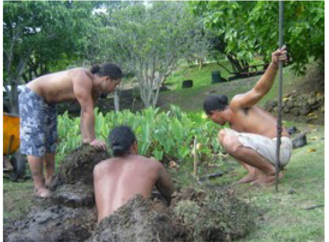
Aia nō ke ola i ka hana. Mālama 'ia 'o Hāloa, mālama pū 'ia kānaka.

'āwīwī. E nānā 'oe i kekahi ki'i o nā maka'āinana o ka wā kahiko, momona anei lākou? 'A'ole, no ka mea, 'o ka po'e waiwai wale nō ka po'e momona. Ua kauoha wale aku ia po'e waiwai i kā lākou makemake. Pono kākou e 'ai i ka mea 'ai i kanu 'ia a me nā hua 'ai. Mai