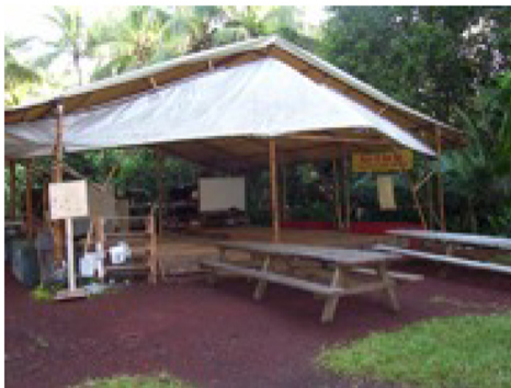
Eia ka hālau a mākou i noho pū ai me nā makika a me nā manakuke.

E noho ana au ma ka‘u pākaukau, a ua ho‘omana‘o a‘ela au i nā mea ho‘opihohoi ma Puna. Ua ho‘i mākou i kekahi ‘ao‘ao o ka mokupuni i kahi hope loa a mākou i kipa ai. Ua hō‘ea mākou ma kekahi kula kaiapuni. ‘Ano like ke kula me ke kūlanakauhale li‘ili‘i. Ua hui mākou i nā haumāna mai ke kula a ho‘okama‘āina maila mākou kekahi i kekahi. Kūkulu ‘ia akula ke kula ma luna o ke kūlanakauhale lawai‘a kahiko. Ua ho‘olako ka po‘e o ia kūlanakauhale i ka i‘a no ke ahupua‘a holo‘oko‘a.