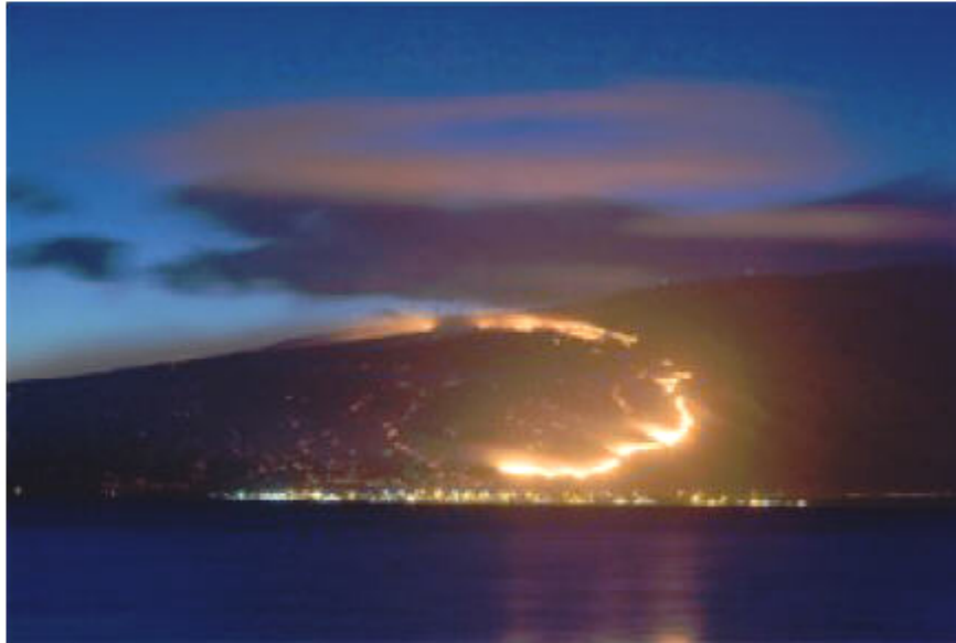
'A'ole paha e 'ae ana ke kuahiwi i ia kumu hao.